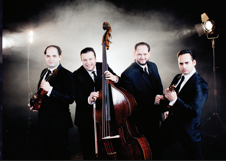
Ensemble JANOSKA "De Mozart aux Beatles!"