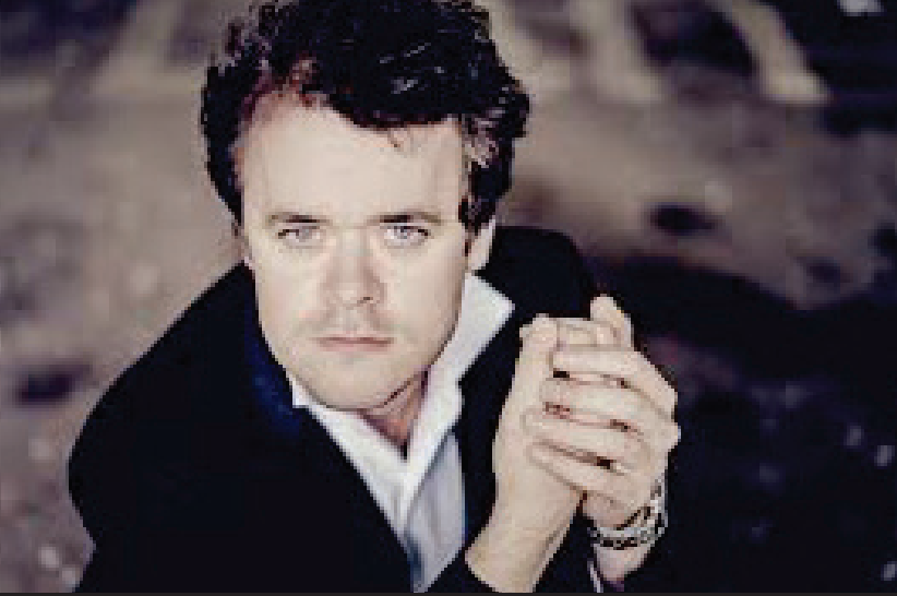
Benjamin GROSVENOR Récital "Liszt et Chopin"